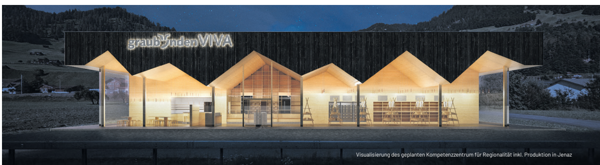
Visualisierung des geplanten Kompetenzzentrum für Regionalität inkl. Produktion in Jenaz